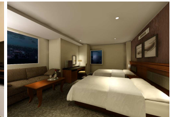
▲レディースルーム