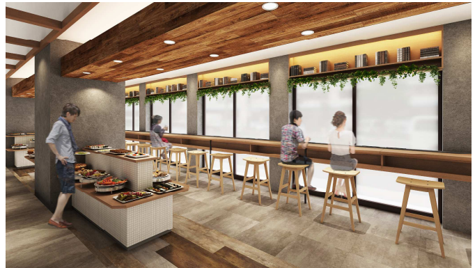
▲朝食会場 兼 カフェスペース

穴吹エンタープライズ株式会社（本社：香川県高松市、代表取締役社長：富岡徹也）が運営する、チサン イン 高松は、2018年7月1日（日）より装い新たに『チサン グランド 高松』としてリブランドいたします。5月より全客室117室の改装工事を順次実施しており、その他朝食会場兼カフェスペースの改装、フィットネスルーム・レディースフロアの新設等を予定しております。