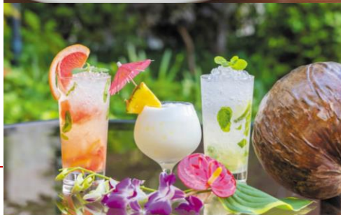
パンケーキ(上) / ハワイアンカクテル(下)