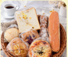
アミチャーペーカリー