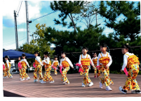
ふらっとダンススクール