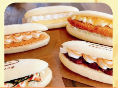
ナナブノハチくち〜な