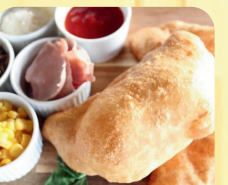
Friggitoria AL CENTRO