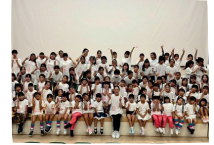
DANCE FACTORY Bounce Pure