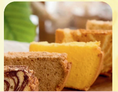
シュクレシフォン