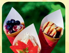
Van de Crepe