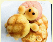
パン工房トントウ