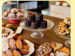
洋菓子店 アントアント