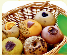
スマイルハートあずみ