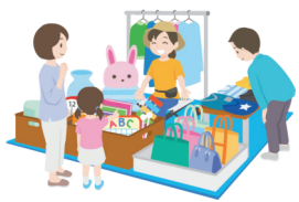
屋内フリーマーケット