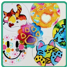
ヒカリノシズク (ディンプルアート)