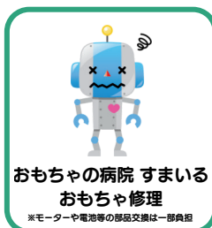
おもちゃの病院 すまいる おもちゃ修理 ※モーターや電池等の部品交換は一部負担