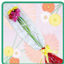
国村園芸 (プチブーケ)