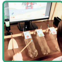
ミライミガキ (ゲーム体験)