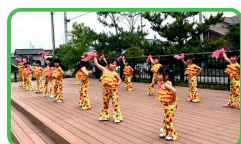
10:00~10:30 ふらっと☆ダンススクール