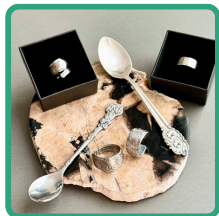
CRAF.SPOON RING (指輪作り)