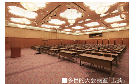
■多目的大会議室「玉藻」