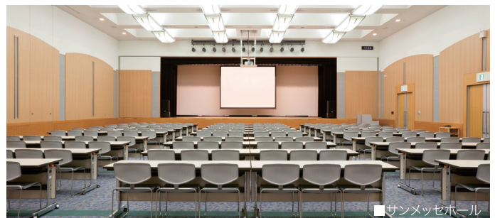
■サンメッセホール

※記載内容は、平成28年7月1日時点の内容です。※内容は事前のご案内なしに変更させていただく場合がございます。